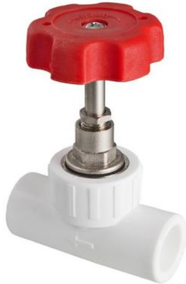
ВЕНТИЛЬ З ПОЛІПРОПІЛЕНОВИМ КОРПУСОМ

Виробник: VALTEC s.r.l., Via Pietro Cossa, 10, 25135-Brescia, ITALY